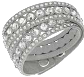
SLAKE DOT BRACELET cod. SW5201119 - € 69.00

Questa novità nell'apprazziatissima collezione Slake aggiungerà una brillantezza ricercata ad ogni mise. Realizzato in squisito Alcantara® bianco e tempestato di Clear Crystal, il nuovo bracciale sfoggia cristalli più grandi a taglio tondo. Solo o con altri bracciali, compone uno stile decisamente distintivo. Misura bracciale: 36 cm.