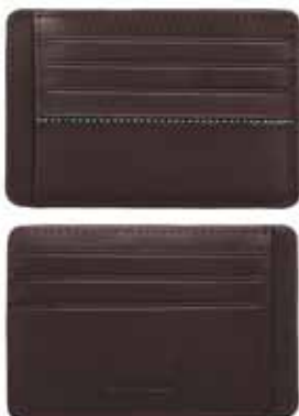
Classic Slim Card Holder cod. SW5186986 - € 54.00

L'organizer Swarovski in pelle nera è impreziosito da cristalli Jet; accessorio pratico e raffinato. Oltre all'agenda 2016 con fogli di pregiata qualità e ad una penna nera, vi sono tre scomparti porta carte di credito. Dimensioni: 22,6x3x15,5 cm.