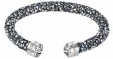
CRYSTALDUST CUFF, M cod. SW5250071 - € 69.00

Davvero irresistibile, il nuovo bracciale rigido CrystalDust, evoluzione dei modelli Stardust and Slake. Realizzato con l'esclusiva finitura Crystal Rock Swarovski, il gioiello è tempestato di cristalli argentati per una brillantezza unica. L'attualissimo profilo aperto garantisce una vestibilità confortevole a questa creazione lineare, valorizzata dai cristalli fissati sui terminali in acciaio.