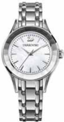
ALEGRIA WATCH cod. SW5188848 - € 299.00

Fascino irresistibile e contemporaneo per questo prezioso strumento da polso, ideale per le occasioni più formali. Il cinturino è interpretato in Crystal Mesh su base in Alcantara® bianco, fissato alla cassa in acciaio con quadrante madreperla bianca e 11 indici in cristallo applicati a mano. Cassa 28 mm; impermeabile fino a 30 m; Swiss Made.