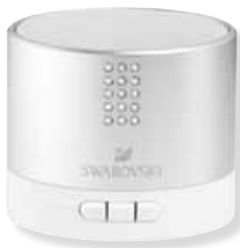
BLUETOOTH SPEAKER cod. SW5276631 - € 29.00

Con l'altoparlante Bluetooth portatile e leggero, è possibile ottenere un suono cristallino ovunque ci si trovi, che sia al lavoro o nel tempo libero. Un oggetto pratico ed impreziosito da 15 cristalli, condensa tutto il fascino Swarovski. Dimensioni: ø5,9x5 cm.