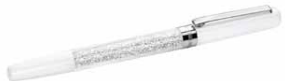
CRYSTALLINE STARDUST ROLLERBALL PEN, IF Box cod. SW5213600 - € 49.00

Le possibilità di scrittura si sdoppiano ma sempre con stile, con la penna Swarovski. Il corpo di questa versione nera contiene circa 1300 Clear Crystal, per assicurare la massima brillantezza in ogni occasione. La penna è proposta con un'apposita confezione insieme ad una dotazione di refill.