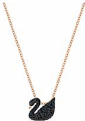
ICONIC SWAN PENDANT, S cod. SW5204133 - € 69.00

Perfetto per San Valentino, il raffinato pendente propone un cristallo rubino a cuore incorniciato dal pavé di Clear Crystal. Il gioiello è abbinato ad una catenina rodiata. Lunghezza: 40 cm. Dimensione pendente: 2,5x2,5 cm.