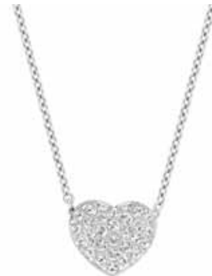
HEART PENDANT cod. SW1809006 - € 79.00

Realizzato insieme a Miranda Kerr, il pendente-simbolo è perfetto da indossare con altri gioielli per interpretare lo stile più attuale. La creazione abbina pavé di Clear Crystal, un delicato cristallo azzurro e un motivo circolare in metallo placcato oro rosa per una brillantezza irresistibile. Un'idea regalo davvero brillante! Il pendente misura 1 x 1,5 cm ed è abbinato ad una catena di 38 cm.