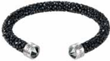
CRYSTALDUST CUFF, M cod. SW5250073 - € 69.00

Davvero irresistibile, il nuovo bracciale rigido CrystalDust, evoluzione dei modelli Stardust and Slake. Realizzato con l'esclusiva finitura Crystal Rock Swarovski, il gioiello è tempestato di cristalli neri per una brillantezza unica. L'attualissimo profilo aperto garantisce una vestibilità confortevole a questa creazione lineare, valorizzata dai cristalli fissati sui terminali in acciaio.