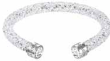
CRYSTALDUST CUFF, M cod. SW5250072 - € 69.00

Davvero irresistibile, il nuovo bracciale rigido CrystalDust, evoluzione dei modelli Stardust and Slake. Realizzato con l'esclusiva finitura Crystal Rock Swarovski, il gioiello è tempestato di cristalli neri per una brillantezza unica. L'attualissimo profilo aperto garantisce una vestibilità confortevole a questa creazione lineare, valorizzata dai cristalli fissati sui terminali in acciaio.