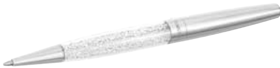
CRYSTALLINE STARDUST BALLPOINT PEN, IF BOX cod. SW5113320 - € 29.00

I riflessi argentati dei circa 400 cristalli, presenti all'interno della penna, sono impreziositi dal ricorso all'esclusiva tecnica Crystal Rock Swarovski, per darle un tocco di eleganza. Il design propone un alternarsi di nuance nere e metalliche e il logo Swarovski posizionato sul fermaglio aggiunge preziosità alla penna a sfera, il cui refill è facilmente sostituibile.