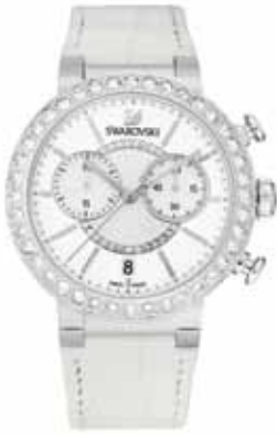
CITRA SPHERE CHRONO WATCH cod. SW5027127 - € 399.00

Uno strumento da polso pieno di luce, per sottolineare ogni vostro abito con un tocco elegante e prezioso. Cassa 38 mm in acciaio e profilo impreziosito da 40 Clear Crystal; quadrante con motivo radiale bianco argento e motivo circolare concentrico con pavé in Clear Crystal, due contatori ai lati, indici rodiali applicati, logo Swan a ore 12 e datario a ore 6; cinturino in vitello bianco con goffratura cocco; movimento svizzero al quarzo.