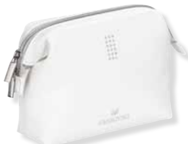
MAKE-UP POUCH cod. SW5276635 - € 19.00

Power Bank 2600 mA/h in alluminio e ABS, adatto per tutti i dispositivi mobili, facile da trasportare, impreziosito da 15 cristalli, condensa tutto il fascino Swarovski. Dimensioni: ø2,4x9,8 cm.