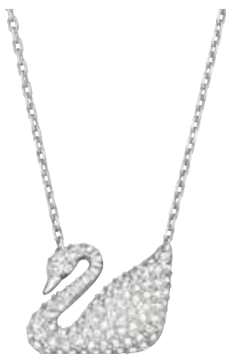
SWAN NECKLACE cod. SW5007735 - € 79.00

Femminile e romantico, il versatile pendente rodiato diventa protagonista sia indossato solo o con altri gioielli, per un attualissimo stile sovrapposto. Il motivo a chiave è impreziosito dai Clear Crystal, per un'idea regalo preziosa e raffinata. Il gioiello è abbinato ad una catenina. Lunghezza: 60 cm. Dimensione pendente: 5x2,5 cm.