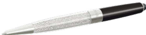
CRYSTALLINE STARDUST STYLUS PEN, IF BOX cod. SW5136528 - € 39.00

Perfetta da regalare! La raffinata penna a sfera è interpretata nelle nuance oro rosate. Il fusto accoglie circa 1300 Clear Crystal i cui suggestivi bagliori accompagnano ogni movimento della mano. La penna è abbinata ad un sacchetto di velluto. Il pratico refill di alta qualità è facile da sostituire.