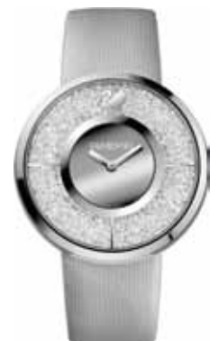
CRYSTALLINE SILVER WATCH cod. SW1135990 - € 299.00

L'eleganza classica di questo modello ne fa un accessorio particolarmente versatile, da indossare a tutte le ore del giorno. Cassa 34 mm in acciaio con 48 Clear Crystal; quadrante con motivo radiale bianco argento e indici rodiali, logo Swan a ore 12; cinturino in pelle di vitello bianco con fibbia ad ardiglione in acciaio; impermeabile; movimento svizzero al quarzo.