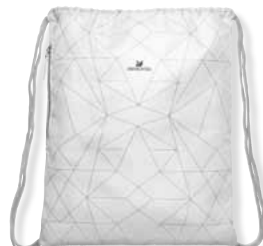
DRAWSTRING BAG cod. SW5247188 - € 29.00

Chic Make-up Pouch, impreziosito da diciotto cristalli Swarovski. Il design classicamente elegante, la rende il complemento perfetto per qualsiasi borsetta. Dimensioni: 18x13,5x6 cm.