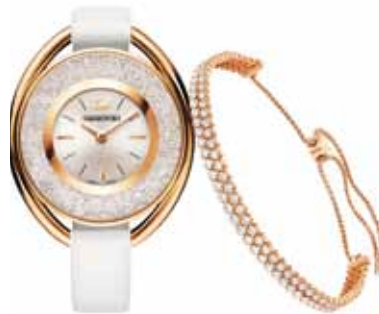
CRYSTALLINE OVAL WATCH SET cod. SW5262995 - € 379.00

Incorpora l'esclusiva lunetta in cristallo sfaccettato, questo raffinato orologio dalla brillantezza discreta. Cassa e cinturino sono sapientemente realizzati in acciaio con finitura tinta oro rosa, mentre la lunetta è in cristallo fumé e il quadrante propone un elegante motivo radiale grigio. Cassa 33 mm; impermeabile fino a 50 m; Swiss Made.