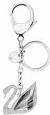
SWAN PAVÉ BAG CHARM & KEYRING cod. SW5201631 - € 79.00

Il classico charm per borsa rodato richiama la collezione di gioielli Fortunately Swarovski. Il motivo rétro ad ala è squisitamente realizzato in pavé di Clear Crystal, e il charm comprende inoltre una medaglietta Swarovski, un fermaglio a moschettone ed un anello portachiavi. Un'idea dono elegante per una persona cara. Dimensioni charm: 9,5 x 2,5 x 0,8 cm.