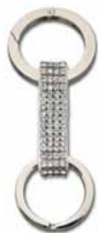
ALICE KEYRING cod. SW860475 - € 65.00

Sintesi di eleganza sportiva! Il bracciale propone un design a maglie circolari che alterna il metallo rodato alla luminosità del pavé di cristallo Clear Crystal. Il gioiello è completato da una pratico fermaglio a "T". Lunghezza: 18 cm.