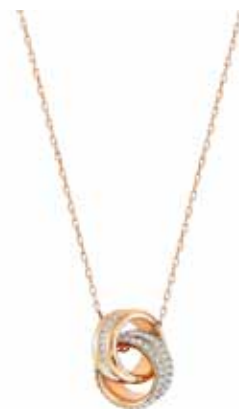
FURTHER PENDANT, S cod. SW5240525 - € 99.00

Raffinato ed elegante, il pendente Swarovski al contempo classico ed attualissimo è un vero must! La lucentezza della rodiatura dell'anello esterno fa da contraltare alla brillantezza dell'anello interno caratterizzato da un classico pavé di cristalli. Questo gioiello dispone di una collana ed è ideale per tutti i giorni. Lunghezza: 38 cm. Dimensione pendente: 2,5x2 cm.