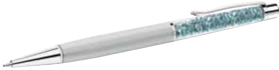
CRYSTALLINE LADY BALLPOINT PEN, IF BOX cod. SW5119273 - € 35.00

Il design pulito della penna a sfera Silver Pearl esprime una raffinata femminilità. Il corpo contiene 160 luminosi cristalli Indian Sapphire. La penna è presentata in un'elegante bustina in velluto. La ricarica di alta qualità è pratica e intercambiabile. Il regalo perfetto per persone speciali!