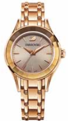
ALEGRIA WATCH cod. SW5188842 - € 349.00

Incorpora l'esclusiva lunetta in cristallo sfaccettato, questo raffinato orologio dalla brillantezza discreta. L'accostamento del quadrante madreperla a cassa e cinturino in acciaio compone un insieme particolarmente raffinato e femminile. Cassa 33 mm; impermeabile fino a 50 m; Swiss Made.