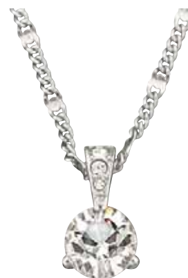
SOLITAIRE PENDANT cod. SW1800045 - € 79.00

Questo elegante pendente rodiato esprime la grazia e l'eleganza del cigno. Delicatamente impreziosito con clear crystal pavé e abbinato ad una catenina, il monile conferisce brillio a qualsiasi mise. Lunghezza: 40 cm. Dimensione pendente: 1,5x1,5 cm.