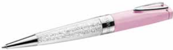
CRYSTALLINE STARDUST USB PEN 16GB, IF Box cod. SW5213611 - € 79.00

Scrivete senza rinunciare allo stile con la nuova penna Swarovski. L'originale profilo del fusto in metallo laccato nero culmina in un esclusivo cristallo asimmetrico ad ala per accompagnare la vostra calligrafia con delicati riverberi. Forma e funzionalità si fondono in un accessorio di pregio, perfetto da regalare. Il logo Swarovski adorna il fermaglio metallico, e la cartuccia d'inchiostro di alta qualità è facile da sostituire. Dimensioni penna: 14 x 1,1 cm.