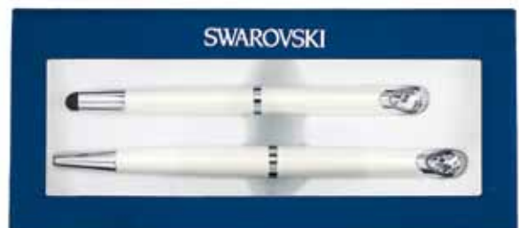
CRYSTAL STARLIGHT STYLUS PEN & BALLPOINT PEN SET cod. SW5224364 - € 75.00

La penna si sdoppia! La penna a sfera USB Swarovski è proposta in metallo laccato nero, la cui superficie lucida esalta la brillantezza dei circa 1300 cristalli contenuti nel suo corpo. L'estremità ospita una chiavetta USB da 16GB. Completa di fermaglio, la penna è proposta in un'esclusiva confezione Swarovski. La sostituzione del refill è particolarmente pratica. Per un'idea regalo personalizzata, perché non caricare qualche foto o brano musicale sulla chiavetta USB?