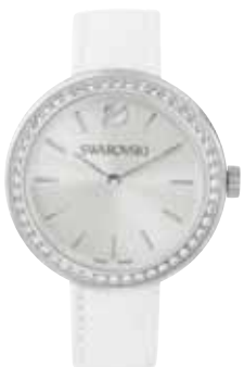
DAY TIME WATCH cod. SW5095603 - € 199.00

Indossate lo stile Swarovski al polso con questo raffinato set che comprende un orologio Crystalline Oval e un discreto bracciale placcato oro rosa. Il cinturino in pelle bianca dell'orologio, il quadrante con motivo radiale bianco argentato e il metallo placcato oro rosa si abbinano mirabilmente al profilo pulito della cassa, impreziosita da oltre 1700 cristalli. Descrizione: Cassa 37 mm; impermeabile fino a 30 m; Swiss Made. Il bracciale è realizzato in metallo placcato oro rosa e pavé di Clear Crystal. Un insieme di grande femminilità, perfetto da regalare ad una persona speciale.