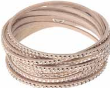
SLAKE BRACELET cod. SW5043495 - € 69.00

Davvero irresistibile, il nuovo bangle CrystalDust, evoluzione dei modelli Stardust and Slake. Realizzato con l'esclusiva finitura Crystal Rock Swarovski, il gioiello è tempestato di cristalli sfumati in nuance scure per una brillantezza unica. L'attualissimo profilo a spirale coniuga versatilità ed espressività attraverso una forma essenziale, valorizzata dai cristalli fissati sui terminali in acciaio. Indossatelo al polso per una immediata nota seducente, e sovrapponetelo se preferite uno stile d'impatto.