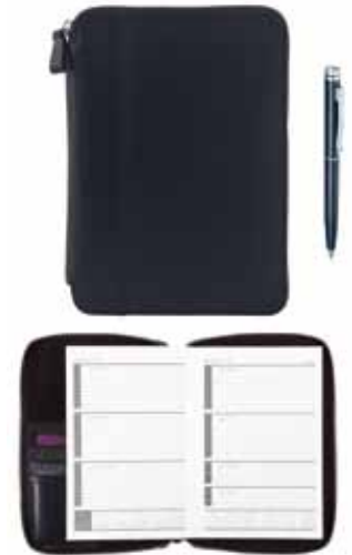
Classic Organizer Agenda cod. SW5186958 - € 184.00

Un accessorio ideale da regalare o da regalarsi. Per il vostro denaro e le vostre carte di credito scegliete la squisita artigianalità di questo portafoglio Swarovski in pelle blu intenso. Le dimensioni generose dell'accessorio sono impreziosite da un discreto motivo in Crystal Silver Shade. All'interno vi sono un portamonete centrale con zip e otto scomparti porta carte di credito. Dimensioni: 10,3x20,5x2,5 cm.