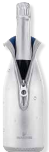
CHAMPAGNE COOLER cod. SW5231602 - € 19.00

Con l'altoparlante Bluetooth portatile e leggero, è possibile ottenere un suono cristallino ovunque ci si trovi, che sia al lavoro o nel tempo libero. Un oggetto pratico ed impreziosito da 15 cristalli, condensa tutto il fascino Swarovski. Dimensioni: ø5,9x5 cm.