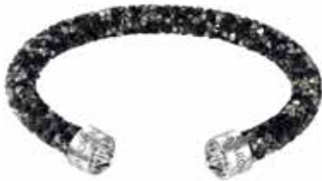
CRYSTALDUST CUFF, M cod. SW5250065 - € 69.00

Davvero irresistibile, il nuovo bracciale rigido CrystalDust, evoluzione dei modelli Stardust and Slake. Realizzato con l'esclusiva finitura Crystal Rock Swarovski, il gioiello è tempestato di cristalli cromati per una brillantezza unica. L'attualissimo profilo aperto garantisce una vestibilità confortevole a questa creazione lineare, valorizzata dai cristalli fissati sui terminali in acciaio.