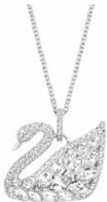
SWAN LAKE PENDANT cod. SW5169080 - € 149.00

Il raffinato pendente rodiato esprime tutta la grazia dell'iconico cigno Swarovski. La delicatezza del pavé di Clear Crystal e dei cristalli a taglio marquise aggiunge luminosità al gioiello, perfetto da indossare con ogni mise. Il pendente misura 2,5 x 2,5 cm ed è abbinato ad una catenina rodiata di 38 cm. Indossatelo con una collana corta per interpretare l'attualità dello stile stratificato.