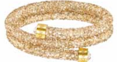
CRYSTALDUST BANGLE, M cod. SW5237763 - € 89.00

Davvero irresistibile, il nuovo bangle CrystalDust, evoluzione dei modelli Stardust and Slake. Realizzato con l'esclusiva finitura Crystal Rock Swarovski, il gioiello è tempestato di cristalli neri per una brillantezza unica. L'attualissimo profilo a spirale coniuga versatilità ed espressività attraverso una forma essenziale, valorizzata dai cristalli fissati sui terminali in acciaio. Indossatelo al polso per una immediata nota seducente, e sovrapponetelo se preferite uno stile d'impatto.