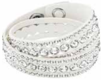
SLAKE DOT BRACELET, M cod. SW52406232 - € 69.00

Questa novità nell'apprazziatissima collezione Slake aggiungerà una brillantezza ricercata ad ogni mise. Realizzato in squisito Alcantara® bianco e tempestato di Clear Crystal, il nuovo bracciale sfoggia cristalli più grandi a taglio tondo. Solo o con altri bracciali, compone uno stile decisamente distintivo. Misura bracciale: 36 cm.