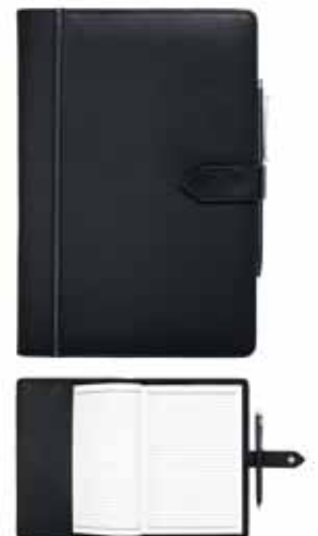
Classic Organizer Note Book cod. SW5186949 - € 169.00

Modern iPad Sleeve combina l'estetica elegante alla funzionalità nella protezione di tutti i giorni per il tuo iPad Air 2. Tre slot porta carte di credito e tre tasche porta documenti sul retro aiutano ad organizzare l'attività. Realizzato in materiale strutturato e pelle nera italiana, oltre a borchie decorative con scintillanti perni Rose. Dimensioni: 18,5x24,7x0,4 cm.