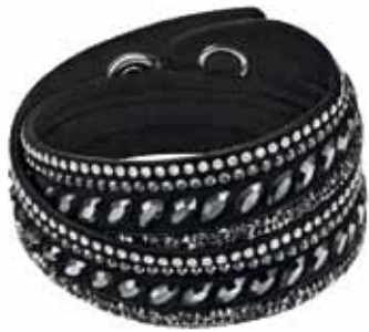
SLAKE PULSE BRACELET, M cod. SW5225974 - € 69.00

Questa avvincente nuova aggiunta all'apprazziatissima collezione Slake ha tutti i numeri per diventare un classico altrettanto intramontabile! Realizzato in Alcantara® grigio tempestato di cristalli in un suggestivo alternarsi di tagli tondi e sagomati, elementi cromati e file di Crystal Rock, il gioiello è decisamente attuale. Indossatelo solo o con altri bracciali se desiderate una brillantezza amplificata.