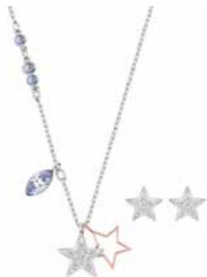
DUO SET STAR cod. SW5140839 - € 99.00

Il raffinato pendente rodiato esprime tutta la grazia dell'iconico cigno Swarovski. La delicatezza del pavé di Clear Crystal e dei cristalli a taglio marquise aggiunge luminosità al gioiello, perfetto da indossare con ogni mise. Il pendente misura 2,5 x 2,5 cm ed è abbinato ad una catenina rodiata di 38 cm. Indossatelo con una collana corta per interpretare l'attualità dello stile stratificato.