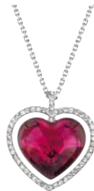
BALLET PENDANT cod. SW5076865 - € 119.00

Ideato insieme a Miranda Kerr, il set alterna placature diverse definendo uno stile romantico e raffinato, e comprende un pendente abbinato a una catenina e un paio di orecchini. I motivi a stella e i cristalli conferiscono pregio alla parure, che aggiungerà un tocco di fascino al vostro guardaroba. Lunghezza collana: 38 cm Lunghezza orecchini: 0,5 cm.