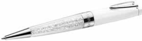
CRYSTALLINE STARDUST USB PEN 16GB, IF Box cod. SW5136847 - € 79.00

La penna si sdoppia! La penna a sfera USB Swarovski è proposta in metallo laccato bianco, la cui superficie lucida esalta la brillantezza dei circa 1300 cristalli contenuti nel suo corpo. L'estremità ospita una chiavetta USB da 16GB. Completa di fermaglio, la penna è proposta in un'esclusiva confezione Swarovski. La sostituzione del refill è particolarmente pratica. Per un'idea regalo personalizzata, perché non caricare qualche foto o brano musicale sulla chiavetta USB?