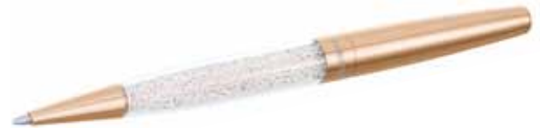
CRYSTALLINE STARDUST BALLPOINT PEN, IF BOX cod. SW5113324 - € 29.00

L'elegante penna a sfera è interpretata nella nuance cromata. Il fusto accoglie circa 1300 Clear Crystal i cui suggestivi bagliori accompagnano ogni movimento della mano. La penna è abbinata ad un sacchetto di velluto. Il pratico refill di alta qualità è facile da sostituire.