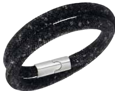
Stardust Double Bracelet, M cod. SW5089844 - € 79.00

L'imperdibile bracciale è composto da un morbido tubolare a rete di nylon che trattiene una miriade di minuti Clear Crystal per un brillante effetto 3D. La creazione è completata da una pratica chiusura magnetica in metallo palladiato, perfetta da abbinare ad altri gioielli da polso.