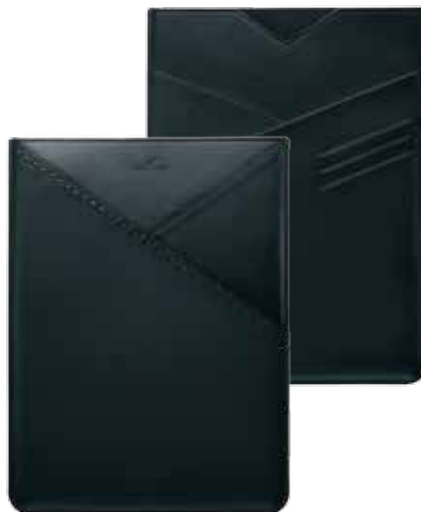
Modern iPad Sleeve cod. SW5277332 - € 169.00

Pratico e discreto, questo accessorio è suddiviso in sei scomparti (tre per lato) per ospitare comodamente carte di credito e biglietti da visita. Il porta carte Swarovski è proposto in una versione in pregiata pelle testa di moro che ne esalta l'artigianalità, ed è impreziosita da un motivo in cristallo Jet Hematite. Dimensioni: 11x7,5x0,7 cm.