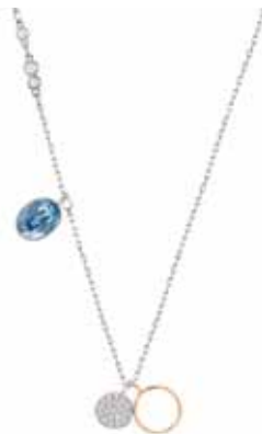
DUO CIRCLE PENDANT cod. SW5198688 - € 69.00

Il sontuoso pendente declina la trasparenza dei cristalli alternandola in profili originali e di assoluto fascino. Il gioiello è placcato rodio, un metallo prezioso che non si ossida. Il pendente misura 1,5 x 4 cm ed è abbinato ad una catena di 40 cm. Personalizzate uno stile attuale e sovrapposto abbinandolo ad altri pendenti.