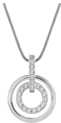
CIRCLE PENDANT cod. SW681251 - € 79.00

Il raffinato pendente placcato oro rosa esprime tutta la grazia del cigno riproponendolo in chiave contemporanea. La delicatezza del pavé di cristallo nero connota il gioiello di una luminosità discreta, perfetta da abbinare ad ogni mise. Il pendente misura 1 x 1 cm ed è abbinato ad una catena placcata oro rosa di 38 cm.