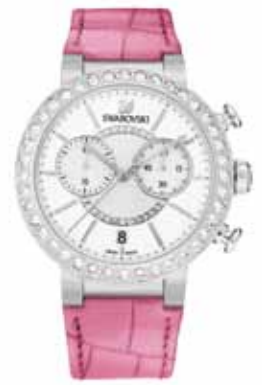
CITRA SPHERE CHRONO WATCH cod. SW5096008 - € 399.00

Uno strumento da polso pieno di luce, per sottolineare ogni vostro abito con un tocco elegante e prezioso. Cassa 38 mm in acciaio e profilo impreziosito da 40 Clear Crystal; quadrante con motivo radiale bianco argento e motivo circolare concentrico con pavé in Clear Crystal, due contatori ai lati, indici rodiali applicati, logo Swan a ore 12 e datario a ore 6; cinturino in vitello bianco con goffratura cocco; movimento svizzero al quarzo.