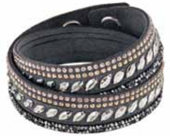
SLAKE PULSE BRACELET, M cod. SW5217154 - € 69.00

Questa novità dell'apprazziatissima collezione Slake aggiungerà una brillantezza ricercata ad ogni mise. Realizzato in Alcantara® grigio, il nuovo bracciale propone grandi Clear Crystal a taglio tondo. Solo o con altri bracciali, compone uno stile decisamente distintivo. Misura bracciale: 36 cm.