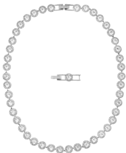
ANGELIC ALL-AROUND NECKLACE cod. SW5117703 - € 199.00

Questo raffinato collier si abbina perfettamente ad altre creazioni dell'apprezzatissima linea Angelic Swarovski. Ideale per le occasioni speciali e da regalare, è interpretato in Clear Crystal e metallo rodato lucido. Lunghezza: 38 cm.