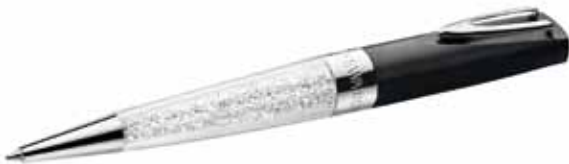
CRYSTALLINE STARDUST USB PEN 16GB, IF Box cod. SW5136846 - € 79.00

La scrittura acquista stile anche sulla vostra periferica intelligente grazie alla raffinatezza della penna stylus Swarovski. L'originale profilo del fusto in metallo laccato bianco culmina in un esclusivo cristallo asimmetrico ad ala per accompagnare i movimenti della mano con delicati riverberi. Un cappuccio a clic protegge la punta e i refill di inchiostro per la penna a sfera sono disponibili. Un'idea regalo preziosa, che coniuga funzionalità ed eleganza. Dimensioni penna: 12,4 x 1 cm.