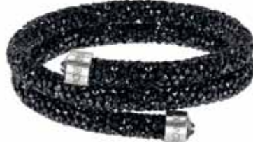
CRYSTALDUST BANGLE, M cod. SW5250023 - € 89.00

Davvero irresistibile, il nuovo bracciale rigido CrystalDust, evoluzione dei modelli Stardust and Slake. Realizzato con l'esclusiva finitura Crystal Rock Swarovski, il gioiello è tempestato di cristalli sfumati in nuance scure per una brillantezza unica. L'attualissimo profilo aperto garantisce una vestibilità confortevole a questa creazione lineare, valorizzata dai cristalli fissati sui terminali in acciaio.