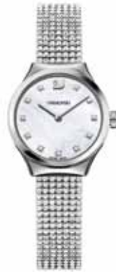
DREAMY WATCH cod. SW5200032 - € 349.00

Sportivo e attuale, ecco un orologio che illuminerà le vostre giornate e ogni vostra mise. Cassa 38 mm in acciaio con 40 Clear Crystal; quadrante con motivo radiale bianco e motivo circolare concentrico con pavé in Clear Crystal, due contatori ai lati, indici rodiali applicati, logo Swan a ore 12 e datario a ore 6; cinturino in pelle di vitello rosa con goffratura cocco e fibbia ad ardiglione in acciaio; impermeabile; movimento svizzero al quarzo.