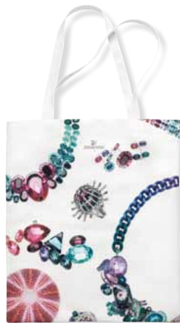
TOTE BAG WITH PATTERN cod. SW5247183 - € 29.00

Festeggia i momenti frizzanti della tua vita, con questa Champagne Cooler in neoprene. Argento all'esterno e Swarovski-blu all'interno, elegantemente ornata con cristalli da Swarovski. Dimensioni: 9x31 cm.