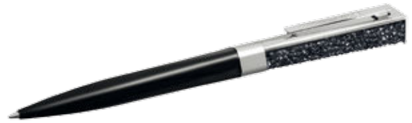
CRYSTALLINE STYLUS PEN, IF BOX cod. SW5135989 - € 49.00

Il design pulito della penna a sfera Silver Pearl esprime una raffinata femminilità. Il corpo contiene 160 luminosi cristalli Indian Sapphire. La penna è presentata in un'elegante bustina in velluto. La ricarica di alta qualità è pratica e intercambiabile. Il regalo perfetto per persone speciali!