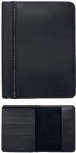
Classic Passport Cover cod. SW5186940 - € 84.00

Raffinata custodia per passaporto Swarovski, nero e motivo in Cristalli Jet. Perfetto da portare in viaggio, oltre al vostro passaporto l'accessorio può contenere fino a tre carte di credito nei pratici alloggiamenti. Dimensioni: 14,2x11x1,1 cm.