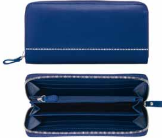
Classic Woman Wallet cod. SW5186956 - € 144.00

Raffinata custodia per passaporto Swarovski, nero e motivo in Cristalli Jet. Perfetto da portare in viaggio, oltre al vostro passaporto l'accessorio può contenere fino a tre carte di credito nei pratici alloggiamenti. Dimensioni: 14,2x11x1,1 cm.