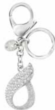
FORTUNATELY BAG CHARM & KEYRING cod. SW5237974 - € 69.00

Il femminile portachiavi in pelle di vitello è impreziosito dalla suggestiva luminosità del Clear Crystal Mesh abbinato all'acciaio. Misura 10 cm.