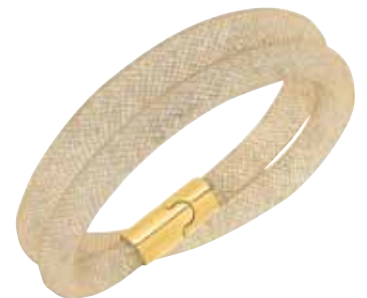
Stardust Double Bracelet, M cod. SW5089836 - € 79.00

Fascino discreto per l'imperdibile gioiello trasformista, che può essere indossato come bracciale doppio o come girocollo. Il tubolare a rete di nylon trattiene una miriade di minuti cristalli neri e crea un profilo 3D. La creazione è completata da una pratica chiusura magnetica in metallo palladiato.