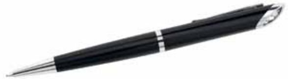
CRYSTAL STARLIGHT PEN cod. SW5224370 - € 39.00

La penna si sdoppia! La penna a sfera USB Swarovski è proposta in metallo laccato bianco, la cui superficie lucida esalta la brillantezza dei circa 1300 cristalli contenuti nel suo corpo. L'estremità ospita una chiavetta USB da 16GB. Completa di fermaglio, la penna è proposta in un'esclusiva confezione Swarovski. La sostituzione del refill è particolarmente pratica. Per un'idea regalo personalizzata, perché non caricare qualche foto o brano musicale sulla chiavetta USB?