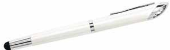
CRYSTAL STARLIGHT STYLUS PEN cod. SW5224381 - € 39.00

Indispensabile per una scrittura sempre brillante e per salvare i vostri file! La penna a sfera USB Swarovski è proposta in metallo laccato rosa ed è impreziosita da circa 1300 cristalli racchiusi nel fusto. L'estremità della penna nasconde una chiavetta USB da 16GB. Lo strumento di scrittura è presentato in una raffinata confezione e il refill è di facile sostituzione. Per un'idea regalo personalizzata perché non caricare qualche foto o brano musicale sulla chiavetta USB?