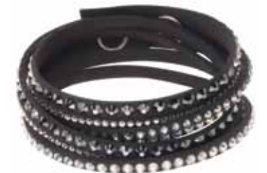
SLAKE DELUXE BRACELET cod. SW5021032 - € 69.00

Un braccialetto irrinunciabile per illuminare i vostri abiti! Il riuscito connubio tra vestibilità confortevole e varietà dei cristalli compone questo monile completato da una base in Alcantara® tinta nudo. Per uno stile sempre attuale, abbinatelo ad altre creazioni della linea Slake. Il braccialetto è regolabile grazie ai due bottoni a pressione posti sulla chiusura (36/38 cm).