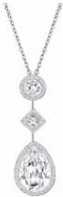
FOLK PENDANT cod. SW5217777 - € 149.00

Il sontuoso pendente declina la trasparenza dei cristalli alternandola in profili originali e di assoluto fascino. Il gioiello è placcato rodio, un metallo prezioso che non si ossida. Il pendente misura 1,5 x 4 cm ed è abbinato ad una catena di 40 cm. Personalizzate uno stile attuale e sovrapposto abbinandolo ad altri pendenti.